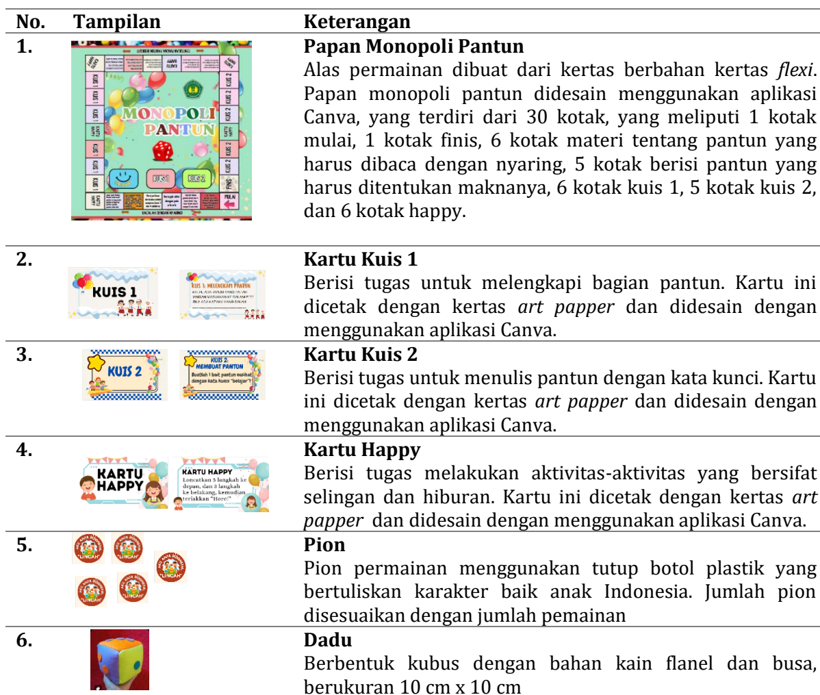
Tabel 1 Desain Pengembangan

Pada prinsipnya isi dari media pembelajaran monopoli pantun versi digital sederhana yang dirancang memiliki substansi yang sama dengan media pembelajaran monopoli pantun versi cetak. Adapun media pembelajaran pantun versi digital sederhana dapat diakses pada link dan barcode berikut: