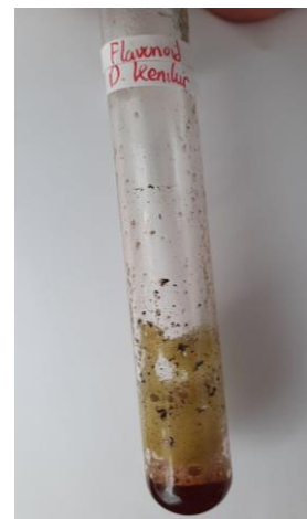
Gambar 7. Hasil uji flavonoid

Gambar 7. menunjukkan hasil positif untuk kandungan flavonoid pada ekstrak daun kenikir. Hal ini berdasarkan hasil larutan uji berubah warna menjadi merah kecokelatan disertai busa. Hasil yang diperoleh sesuai dengan Al Kausar et al. (2023), yang menunjukkan adanya kandungan flavonoid pada ekstrak daun kenikir. Hasil ini juga sejalan dengan penemuan Masitah et al. (2023), melaporkan hasil uji positif flavonoid daun kenikir yang diekstraksi dengan metanol, etanol, dan etil asetat. Kandungan flavonoid pada daun kenikir berpotensi dimanfaatkan sebagai antikanker, antimikroba, antivirus, antigiogenic , antimalaria, antioksidan, neuroprotektif, antitumor, dan agen anti-proliferatif. Senyawa flavonoid juga berperan dalam mencegah penyakit kardio-metabolik (Ullah et al., 2020).