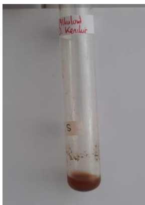
Gambar 6. Hasil uji alkaloid

Uji alkaloid ekstrak daun kenikir menunjukkan hasil positif, ditandai dengan warna larutan yang berubah menjadi putih kecokelatan (Gambar 6.). Masitah et al. (2023), melaporkan hasil uji positif alkaloid daun kenikir yang diekstraksi dengan metanol, etanol, dan etil asetat. Hasil ini juga mendukung penemuan (Al Kausar et al., 2023) yang menunjukkan adanya kandungan alkaloid pada daun kenikir yang diekstraksi dengan methanol. Senyawa alkaloid pada daun kenikir dapat menghambat pertumbuhan Staphulococcus aureus (Al Kausar et al., 2023) sehingga daun kenikir berpotensi dimanfaatkan sebagai anti bakteri. Proses penghambatan pertumbuhan bakteri ini disebabkan oleh kemampuan alkaloid dalam mengganggu komponen peptidoglikan sel bakteri yang berakibat pada kematian bakteri (Handayani et al., 2015). Selain itu, alkaloid memiliki efek farmakologis sebagai anti inflamasi, hepatoprotektor, antikanker, dan meningkatkan efek antioksidan pada sel (Untoro et al., 2016).