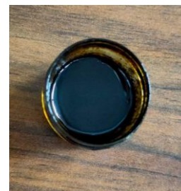
Gambar 1. Ekstrak daun kenikir

tahan terhadap suhu tinggi. Ethanol 70% digunakan sebagai pelarut dalam prosedur maserasi pada penelitian. Penggunaan ethanol 70% didasarkan pada sifat larutan yang polar, universal, toksisitas yang rendah, dan mudah didapat. Polaritas pelarut sangat diperlukan, berkaitan dengan sifat polar dari metabolit sekunder yang akan dideteksi (Kemit et al., 2016). Lama waktu ekstraksi daun kenikir ialah 3x24 jam dengan tujuan meningkatkan komponen bioaktif larutan melalui interaksi antara pelarut dan sampel bahan hingga mencapai titik jenuh (Asworo & Widwastuti, 2023).