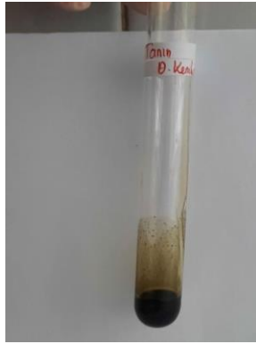
Gambar 5. Hasil uji tanin

Uji alkaloid ekstrak daun kenikir menunjukkan hasil positif, ditandai dengan warna larutan yang berubah menjadi putih kecokelatan (Gambar 6.). Masitah et al. (2023), melaporkan hasil uji positif alkaloid daun kenikir yang diekstraksi dengan metanol, etanol, dan etil asetat. Hasil ini juga mendukung penemuan (Al Kausar et al., 2023) yang menunjukkan adanya kandungan alkaloid pada daun kenikir yang diekstraksi dengan methanol. Senyawa alkaloid pada daun kenikir dapat menghambat pertumbuhan Staphulococcus aureus (Al Kausar et al., 2023) sehingga daun kenikir berpotensi dimanfaatkan sebagai anti bakteri. Proses penghambatan pertumbuhan bakteri ini disebabkan oleh kemampuan alkaloid dalam mengganggu komponen peptidoglikan sel bakteri yang berakibat pada kematian bakteri (Handayani et al., 2015). Selain itu, alkaloid memiliki efek farmakologis sebagai anti inflamasi, hepatoprotektor, antikanker, dan meningkatkan efek antioksidan pada sel (Untoro et al., 2016).