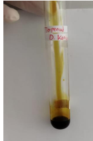
Gambar 4. Hasil uji terpenoid

Keberadaan senyawa terpenoid pada daun kenikir menunjukkan bahwa daun kenikir berpotensi sebagai sumber antioksidan yang efektif. Terpenoid yang diekstrak dari tanaman obat menunjukkan kemampuan imunobiologis dan dapat dimanfaatkan sebagai obat untuk penyakit infeksi. Keberadaan terpenoid pada daun kenikir juga berpotensi dimanfaatkan sebagai obat antikanker dan anti malaria (Harshita et al., 2019; Khanna et al., 2015).