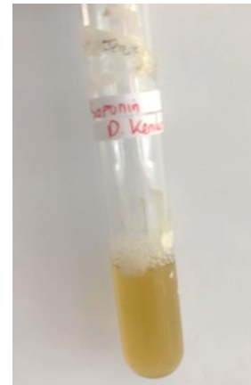
Gambar 2. Hasil uji saponin

Hasil uji saponin pada gambar 2. menunjukkan hasil positif, ditandai dengan adanya busa pada larutan uji.