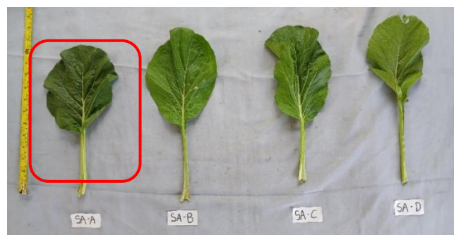
Gambar 1. Bentuk daun terluar A=PSA, B= Tossan, C= Juwita, D= Kometa