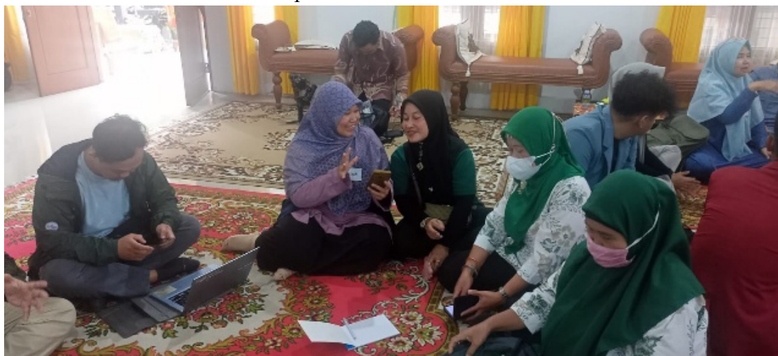
Gambar 2. Pembuatan QRIS

Sesi ini berfokus pada transisi dari transaksi tunai ke non-tunai. Tim menjelaskan konsep dasar e-money (uang elektronik) dan fungsi Quick Response Code Indonesian Standard (QRIS). Pelaksanaan dilakukan secara interaktif, di mana setiap peserta didorong untuk mengunduh dan mengaktifkan setidaknya satu aplikasi dompet digital. Kemudian, dilakukan simulasi transaksi QRIS secara langsung antar sesama peserta. Tim juga memberikan template spanduk QRIS untuk UMKM Banguntani, sehingga mitra langsung memiliki alat untuk mengadopsi sistem pembayaran modern ini. Interaksi yang terjadi bukan hanya tanya jawab, tetapi juga saling membantu antar peserta dalam mengatasi kendala teknis smartphone . Dengan menyediakan QRIS, UMKM dapat melayani pelanggan yang tidak membawa uang tunai, berpotensi meningkatkan transaksi harian sebesar 15-20% berdasarkan tren preferensi konsumen cashless saat ini.