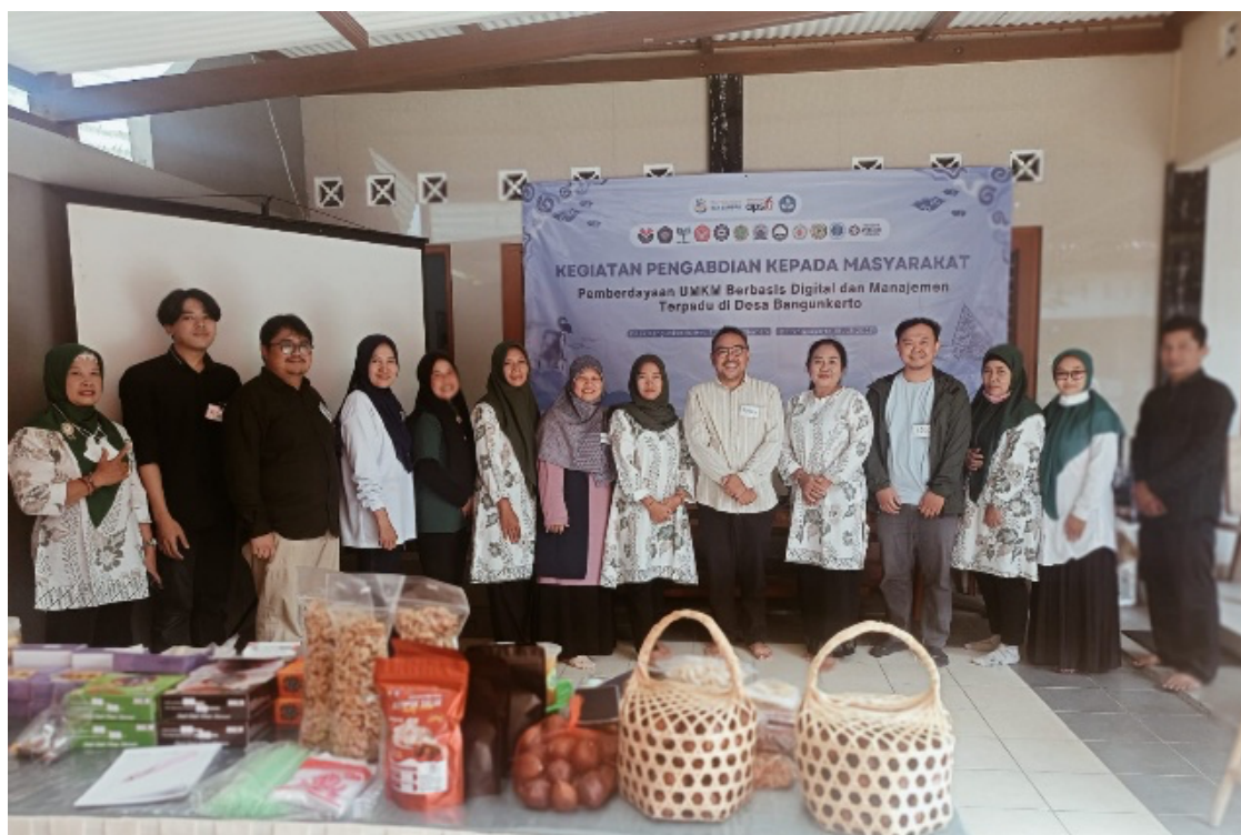
Gambar 4. Dokumentasi bersama

Untuk mengukur dampak pelatihan, digunakan instrumen tes yang menguji pemahaman peserta terkait konsep dan aplikasi keuangan digital. Hasil peningkatan tingkat literasi disajikan dalam tabel berikut: