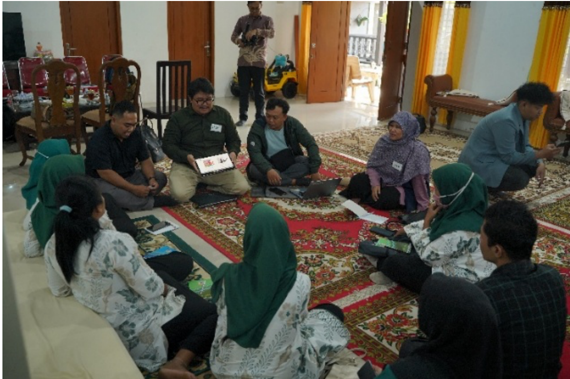
Gambar 3. Role-playing

Mengingat banyak UMKM yang masih kesulitan mengakses modal formal atau terjebak dalam pinjaman ilegal, sesi ini membahas secara mendalam tentang ekosistem Fintech Pendanaan ( Peer-to-Peer Lending ) yang resmi terdaftar di Otoritas Jasa Keuangan (OJK). Tim pengabdian memberikan edukasi kritis tentang cara membedakan pinjaman online legal dan ilegal, risiko bunga, serta persyaratan pengajuan. Materi disampaikan melalui studi kasus nyata dan sesi role-playing di mana tim berperan sebagai petugas pinjaman dan peserta berperan sebagai pengusaha yang mengajukan, membuat suasana menjadi lebih hidup dan pemahaman akan risiko menjadi lebih mendalam.