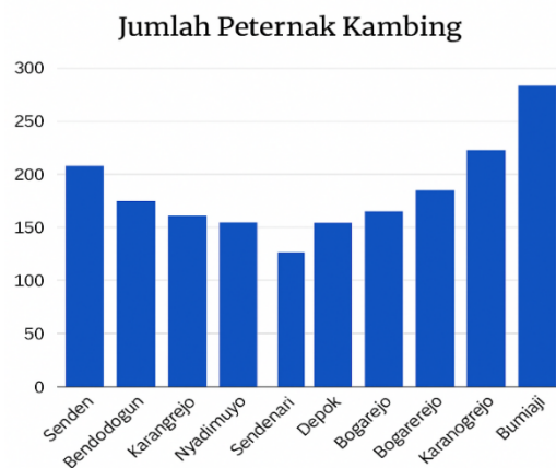
Gambar 1. Jumlah Peternak Kambing Di Desa Kampak 7

Berdasarkan data terbaru pada portal Satu Data Kabupaten Trenggalek yang bersumber dari Dinas Peternakan dan diperbarui tahun 2025, populasi kambing di Kecamatan Kampak pada tahun 2024 tercatat mencapai sekitar 34.000 ekor, menjadikannya salah satu wilayah dengan potensi pengembangan peternakan kambing yang cukup besar di Kabupaten Trenggalek. Kondisi ini menunjukkan bahwa sektor peternakan rakyat, khususnya kambing, memiliki peran penting dalam mendukung perekonomian masyarakat pedesaan di wilayah tersebut 6 .