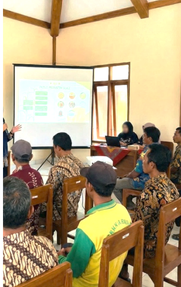
Gambar 3. Sosialisasi Bersama Para Peternak

interaktif yang dilengkapi dengan contoh visual berupa foto dan video proses pembuatan silase dari daerah lain.