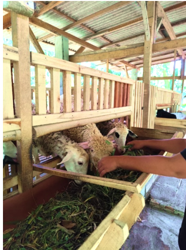
Gambar 6 Peternak sedang memberikan silase kepada kambing di dalam kandang. Silase menggantikan 40–60% hijauan kambing dengan lebih efisien