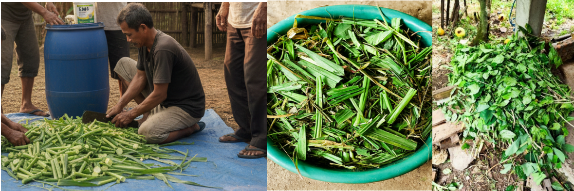
Gambar 4. Hijauan segar hasil pencacahan oleh mitra sebelum proses fermentasi silase. Bahan terdiri dari rumput gajah, daun jagung, dan pelepah pisang yang dicacah berukuran 2–3 cm sesuai SOP.