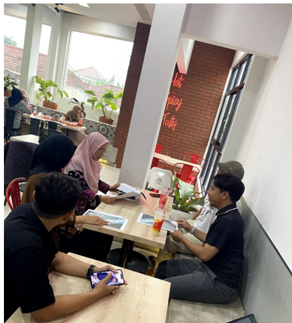
Gambar 3. Proses Pelatihan Halal dengan Membagi menjadi Kelompok Kecil

Selain itu, studi lain menunjukkan bahwa pelatihan halal yang disertai pendampingan teknis mampu mempercepat proses sertifikasi halal dan memperkuat jejaring usaha halal di tingkat lokal, seperti pada Gambar 3 . Pendampingan teknis ini mencakup asistensi dalam penyusunan dokumen, simulasi audit, serta bimbingan terkait penerapan Sistem Jaminan Produk Halal (SJPH) pada skala usaha kecil. Dengan adanya pendampingan, pelaku UMKM tidak hanya memahami prosedur administratif, tetapi juga memperoleh keterampilan praktis dalam melindungi konsistensi mutu produk sesuai standar halal. Pendekatan kolaboratif ini terbukti efektif dalam menjembatani kesenjangan antara teori dan praktik, karena peserta dapat langsung mengaitkan materi pelatihan dengan kebutuhan operasional sehari-hari. Lebih jauh, keberadaan jejaring usaha halal di tingkat lokal memungkinkan terjadinya pertukaran pengalaman, akses informasi pasar, serta peluang kolaborasi lintas sektor yang mendukung keberlanjutan usaha UMKM. Dengan demikian, pelatihan yang terintegrasi dengan pendampingan teknis dan penguatan jejaring usaha halal tidak hanya berkontribusi pada percepatan sertifikasi, tetapi juga memperkuat ekosistem halal yang berdaya saing dan berkelanjutan (Sari et al., 2025).