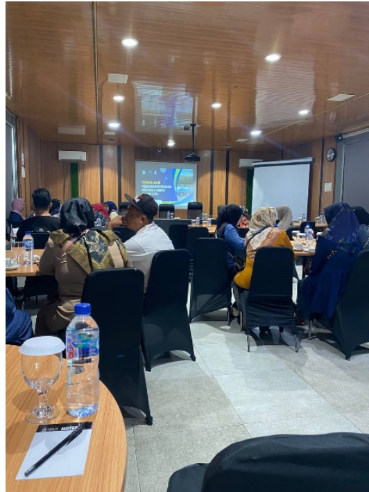
Gambar 1. Kegiatan Pelatihan Halal pada IKM/UMKM

strategi peningkatan daya saing. Model pelatihan ini terbukti efektif dalam meningkatkan kompetensi pendamping halal dan mempercepat proses sertifikasi (Rosana & Iswara, 2021).