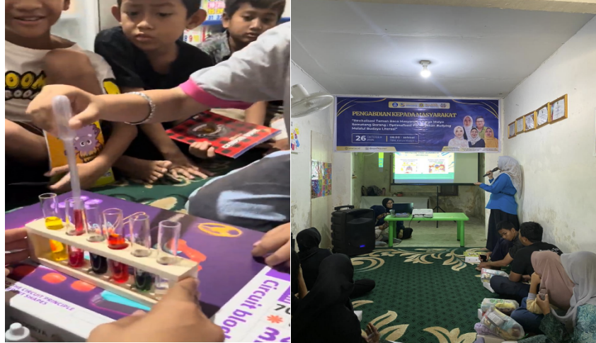
Gambar 2 Aktivitas STEM sederhana dan Materi Untuk Relawan