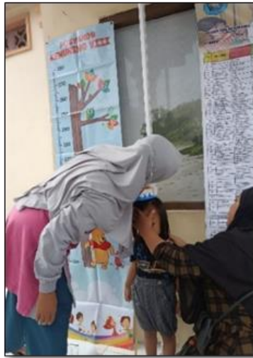
Gambar 2. Penimbangan posyandu balita “Kemuning 8”.

Posyandu balita dapat melakukan berbagai kegiatan yang terfokus pada peningkatan gizi. Memantau pertumbuhan fisik dan perkembangan anak, termasuk berat badan, tinggi badan, dan lingkar kepala adalah salah satu penanganan untuk mengetahui dan mencegah terjadinya stunting pada anak.