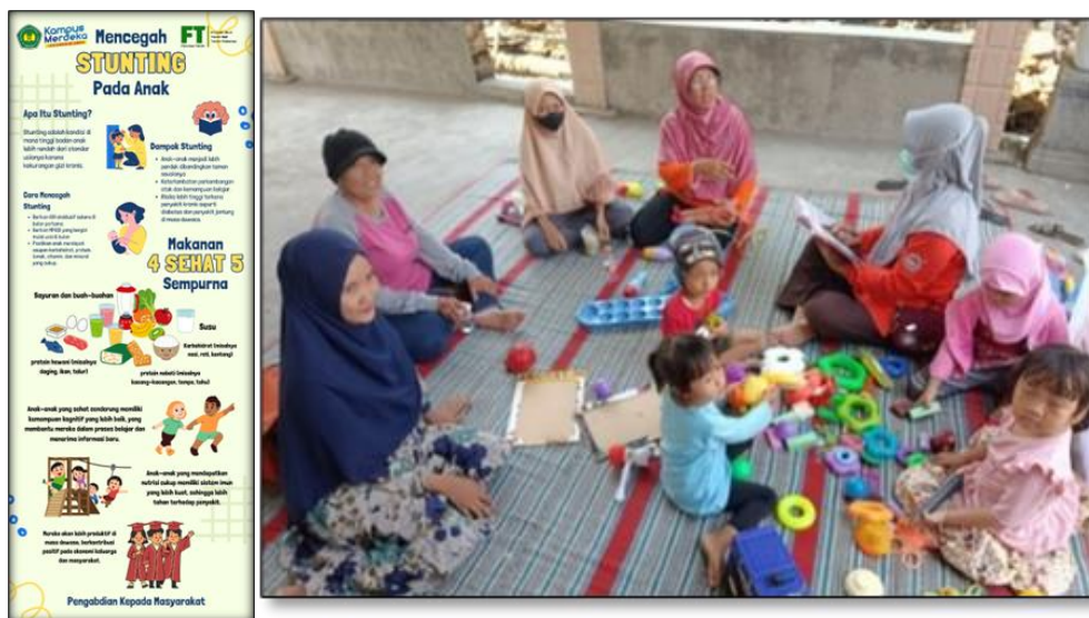
Gambar 4. Sosialisasi makanan 4 sehat 5 sempurna.

Sosialisasi stunting merupakan upaya penting untuk meningkatkan kesadaran masyarakat tentang bahaya stunting dan cara pencegahannya. Sosialisasi dilakukan bersamaan kegiatan posyandu dengan bidan desa setempat. Adapun tujuan dari sosialisasi stunting adalah sebagai berikut: