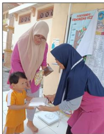
Gambar 3. Pemberian makanan tambahan.

Pemberian Makanan Tambahan (PMT) adalah program yang bertujuan untuk meningkatkan status gizi anak-anak dan ibu hamil, terutama yang mengalami atau berisiko mengalami kekurangan gizi. Tujuan PMT adalah meningkatkan asupan gizi balita dan ibu hamil untuk mencegah dan mengatasi kekurangan gizi, membantu pertumbuhan optimal anak-anak untuk mencegah stunting.