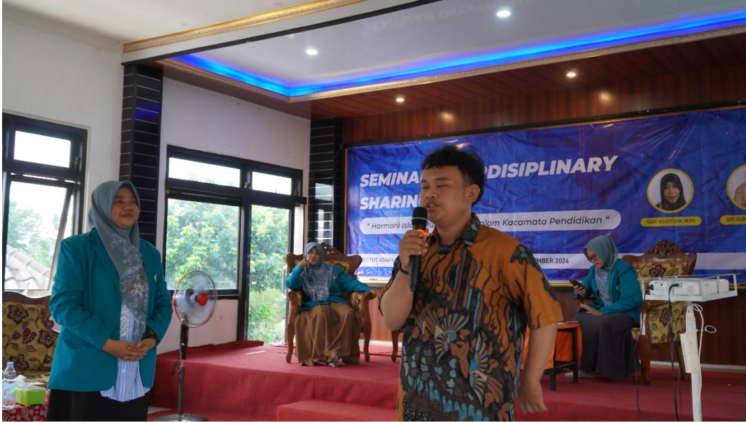
Gambar 2. Agenda sharing peserta dan narasumber

Sesi sharing telah selesai, mahasiswa diminta untuk mengisi angket kepuasan layanan. Form di isi oleh 45 mahasiswa menunjukkan bahwa peserta puas dengan seminar yang telah diselenggarakan, hasil pengisian angket pada tabel berikut: