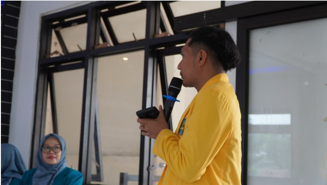
Gambar 1. Peserta menjelaskan maksud video yang telah diputar

Materi pertama berjudul “peran umat islam dalam perdamaian” di dalamnya termuat pembahasan tentang definisi perdamaian, mengemukakan ayat-ayat multikultural, kisah teladan Nabi Muhammad dalam mewujudkan perdamaian, penjelasan miskonsepsi terhadap islam versi barat, konflik yang timbul dengan dalih agama, kontribusi umat islam dalam resolusi konflik internasional serta menguatkan pluralisme sebagai modal toleransi kerukunan. Dari materi awal ini, terlihat peserta menyimak dengan seksama penjelasan dari narasumber. Dilanjutkan materi kedua dengan judul “harmoni islam multikultural dalam praktis pendidikan” termuat pembahasan mengenai konsep pendidikan multikultural versi umum dan islam, kesalahpahaman tentang islam, pentingnya memahami keberagaman budaya di kelas, tantangan menciptakan lingkungan inklusif, strategi mengakomodasi perbedaan latar belakang siswa, peran guru sebagai fasilitator pembelajaran islam multikultural, konsep pembelajaran islam multikultural, kompetensi guru sebagai fasilitator pembelajaran islam multikultural, mengintegrasikan nilai-nilai multikultural dalam pembelajaran islam dan peran guru sebagai agen perubahan dalam pembelajaran islam multikultural.